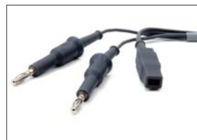
Valleylab Erbe lcc Conmed