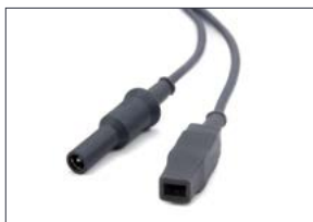
Martin, PME, Berchtold, Matin